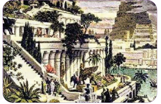
Babil'in Asma Bahçeleri

Bugünkü Irak'ın güneyinde bulunan ve döneminde Babil uygarlığının başkenti olan Babil kentindeki kraliyet sarayındaki bahçelerden oluşur. Babil'in Asma Bahçeleri, bir dizi tapınağın teraslarında kurulmuş olan çatı bahçeleriyleydi. Bu bahçeler, kurulan bir sistemle, Fırat Nehri'nin suyu bu bahçelere pompalanarak yapılıyordu.