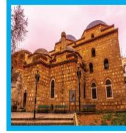
Alaca İmaret Camisi

1. Aşağıda Selanik’te yaşamış milletlere ait yapıların görsellerine yer verilmiştir.