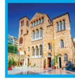
Aziz Dimitrios Kilisesi