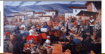
Tekâlif-i Milliye Kanunları ve Türk halkının desteği