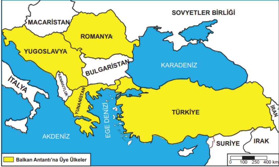
Balkan Antantı'na Üye Ülkeler (9 Şubat 1934)