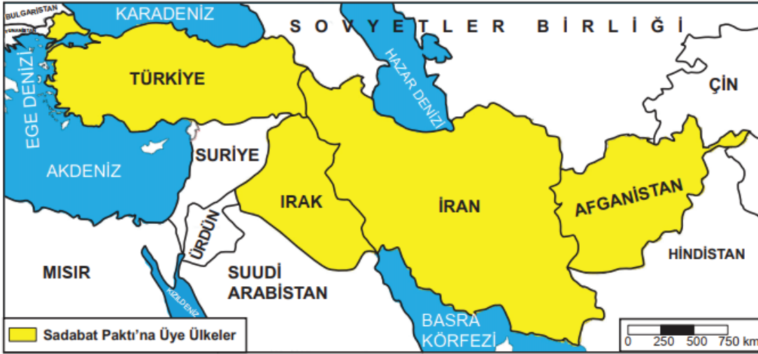
Sadabat Paktı'na Üye Ülkeler (8 Temmuz 1937)