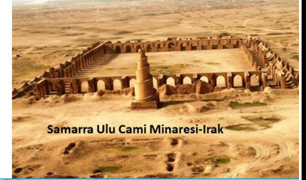
Samarra Ulu Cami Minaresi-Irak

Türkler, askerî yeteneklerinden dolayı Abbasi ordusunda önemli görevler üstlenmişlerdir. Abbasiler, Türklere özel olarak bu şehri kurmuştur.