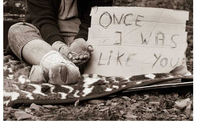
“bir zamanlar senin gibiydim”

Bir yardımlaşma ve dayanışma aracı olan sadaka taşlarının Osmanlı Devleti'nin sosyal hayatında önemli yeri vardı. Sadaka taşları ince düşünülmüş bir yardım vasıtası idi ki o taşa uzatılan bir elin oraya yardım koymak için mi yoksa yardım almak için mi girdiğini bilemezsiniz. Sadaka taşlarına yardım bırakan da yardım alan da genellikle akşamın karanlık saatlerini tercih ederdi. Yardım alan kişiler de ihtiyacı kadarını alırdı. Hatta öyle ki 17. yüzyılda İstanbul'a gelmiş olan bir Fransız seyyah bu taşlardan birinin başında bir hafta beklemesine rağmen bırakılan yardımları almak için kimsenin uğramadığını yazmıştır.