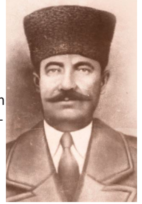
Kuvâ-yı Millîye Komutanı Şahin Bey

“Kirli ayaklarınızın bastığı şu toprakların her zerresinde Türk kanı, her bucağında bir atanın mezarı vardır. Eski zamanlardan beri Türkler bu topraklarda yaşamaktadır. Türk bu topraklara, bu topraklar da Türk'e ısındı, kaydandı. Sadece siz değil, bütün dünya bir araya gelse bizi bu topraklardan ayıramaz. Sonra sen 'Türk, esir yaşamaz.' diye duymadın mı? Namus ve hürriyet için ölüme atılmak bize ağustos sıcaklığında soğuk su içmekten daha tatlı gelir. Sizler canı kıymetli insanlarsınız. Bize çatmayınız. Bir gün evvel topraklarımızdan savuşup gidiniz.”