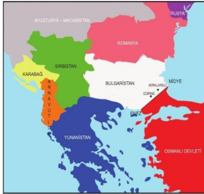
I. Balkan Savaşı Sonrası Osmanlı'nın Batı Sınırları

Yunanistan, Sırbistan, Karadağ ve Bulgaristan ittifak yaparak 1912 yılı Ekim ayında Osmanlı Devleti'ne karşı saldırıya geçti ve böylece I. Balkan Savaşı başladı. Osmanlı bu savaşta başarılı olamadı. 30 Mayıs 1913 tarihinde yapılan Londra Antlaşması yla Midye-Enez Hattı'nın batısındaki bütün toprakları ve Edirne'yi kaybetti.