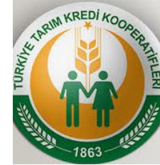
Tarım Kredi Kooperatifleri