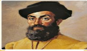
Vasco da Gama (Vasko dö Gama)

Afrika'nın güney ucuna ulaşarak Ümit Burnu'nu keşfetti (1487).