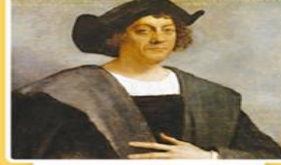
Kristof Colomb (Kıristof Kolomb)

Ümit Burnu'nu dolaşarak Hindistan'a ulaşan ilk Avrupalı denizci oldu (1498).