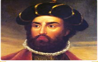
Bartolomeu Dias (Bartelmi Diyaz)

Afrika'nın güney ucuna ulaşarak Ümit Burnu'nu keşfetti (1487).