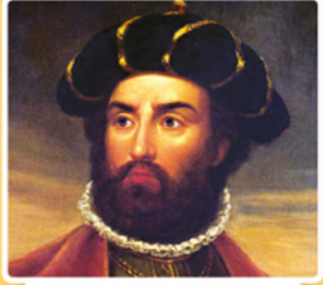
Bartolomeu Dias (Bartelmi Diyaz)

Afrika'nın güney ucuna ulaşarak Ümit Burnu'nu keşfetti (1487).