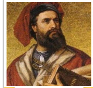
Amerigo Vespucci (Ameriko Vespuçi)

Amerika kıtasına ulaştı ancak burayı Hint adaları zannetti (1492). Amerigo Vespucci (Ameriko Vespuçi) adlı denizci buranın yeni bir kıta olduğunu açıkladı (1507).