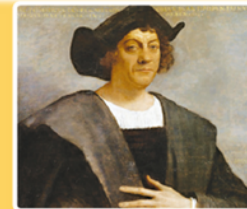
Kristof Colomb (Kristof Kolomb)

Amerika kıtasına ulaştı ancak burayı Hint adaları zannetti (1492). Amerigo Vespucci (Ameriko Vespuçi) adlı denizci buranın yeni bir kıta olduğunu açıkladı (1507).