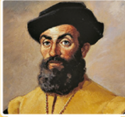
Vasco da Gama (Vasko dö Gama)

Afrika'nın güney ucuna ulaşarak Ümit Burnu'nu keşfetti (1487).