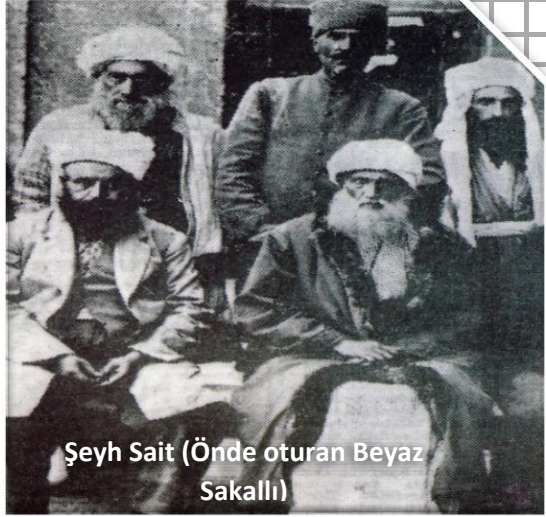
Şeyh Sait (Önde oturan Beyaz Sakallı)