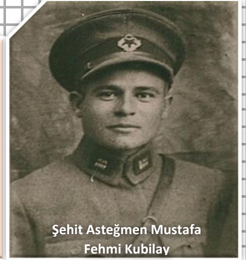
Şehit Asteğmen Mustafa Fehmi Kubilay