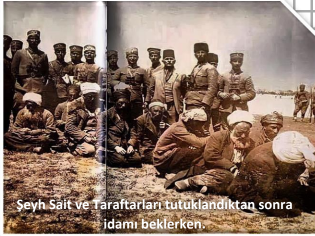
Şeyh Said ve Taraftarları tutuklandıktan sonra idamı beklerken.

Menemen Olayı laikliğe ve Cumhuriyete karşı çıkan ikinci isyandır. Bu olay Ülkemizin çok partili hayata hazır olmadığına ve halka inkılapların iyi anlatılması gerektiğini ortaya çıkarmıştır.