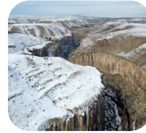
Ihlara Vadisi (Aksaray)