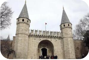
Topkapı Sarayı (İstanbul)