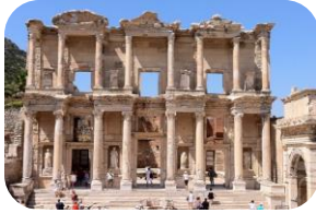
Efes Antik Kenti (İzmir)