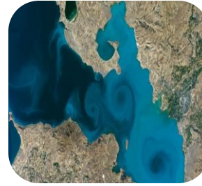
Van Gölü (Van)