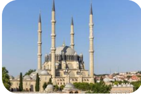
Selimiye Cami (Edirne)