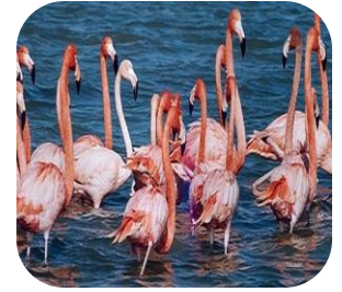
Manyas Kuş Cenneti (Balıkesir)