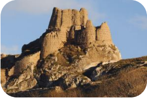
Van Kalesi (Van)