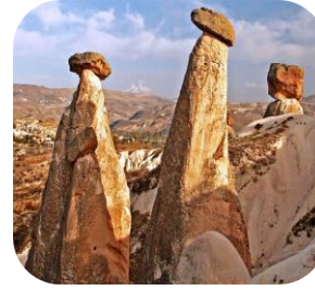
Peri Bacaları (Nevşehir)