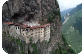
Sümela Manastırı (Trabzon)