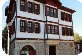
Safranbolu Evleri (Kastamonu)