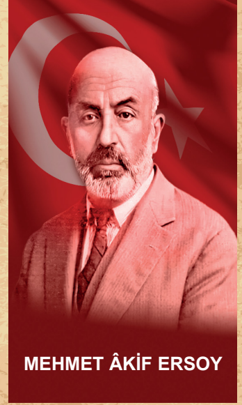
MEHMET ÂKİF ERSOY

İstiklal Marşı yarışmasına 500 lira ödül verileceği için katılmayan şair, yakın çevresinin ısrarı üzerine "millî şiiri" yazmaya başladı. İstiklal Marşı, 12 Mart'ta "millî marş" olarak kabul edildi. Ersoy, ödül olarak verilen 500 lirayı bir hayır kurumuna bağışladı.