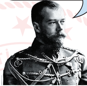
Rus Çarı II. Nikola

En büyük amacımız Osmanlı yönetimindeki Boğazları ele geçirip sıcak denizlere inmekti. Balkanlarda hâkimiyet kurmaya çalıştık. Osmanlı topraklarında yaşayan ve soydaşlarımız olan Slavları kendi amaçlarımız doğrultusunda yönlendirdik.