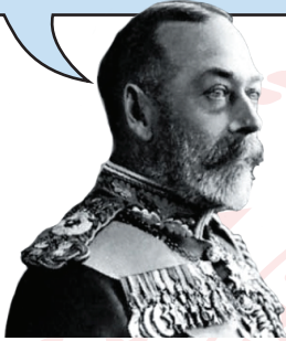
İngiltere Kralı V. George (Corc)

Sanayi İnkılabı'nı ilk gerçekleştiren ve en fazla sömürgeye sahip olan devletiz, "üzerinde güneş batmayan ülke" olarak tanındık. Sömürgelerimizi diğer devletlere kaptırmak için güçlü bir donanmamız vardı. Osmanlının elindeki Orta Doğu petrol alanları, oldukça ilgimizi çekiyordu.