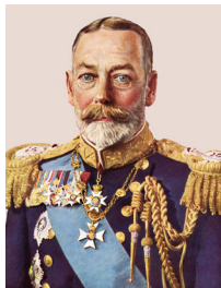
İngiltere Kralı V. George (Corc)

Sanayi İnkılabı'nı ilk gerçekleştiren ve en fazla sömürgeye sahip olan devletiz, "üzerinde güneş batmayan ülke" olarak tanındık. Sömürgelerimizi diğer devletlere kaptırmamak için güçlü bir donanmamız vardı. Osmanlının elindeki Orta Doğu petrol alanları, oldukça ilgimizi çekiyordu.