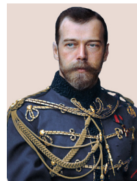
Rus Çarı II. Nikola

En büyük amacımız Osmanlı yönetimindeki Boğazları ele geçirip sıcak denizlere inmekti. Balkanlarda hâkimiyet kurmaya çalıştık. Osmanlı topraklarında yaşayan ve soydaşlarımız olan Slavları kendi amaçlarımız doğrultusunda yönlendirdik.