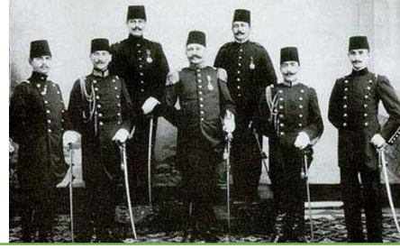
Mustafa Kemal, cemiyetten arkadaşları ile

Mustafa Kemal'in Suriye'de bulunduğu sırada arkadaşlarıyla birlikte kurduğu cemiyet aşağıdakilerden hangisidir?